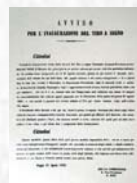
Inaugurazione della Società di Tiro a segno di Reggio Calabria