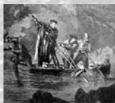
A pesca tra gli scogli di Caprera [stampa popolare]