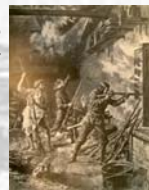
Garibaldi tiratore in una rappresentazione stile western di Linzaghi: "A difesa della fabbrica-arsenale"

"E chi diavolo sognerà d'invadere l'Italia coi suoi due milioni di militi che i nostri nemici hanno conosciuto, sotto il cimiero del bersagliere, come sotto la rossa camicia?"