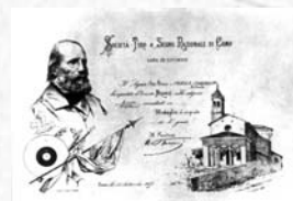
Diploma rilasciato da una delle innumerevoli società di Tiro a segno dedicate a Garibaldi

anno della promulgazione del Regio Decreto che istituiva i Tiri a segno comunali. La pratica del Tiro a segno viene sostenuta da Garibaldi all'interno di un progetto di costituzione dell'Esercito-Nazione a base popolare ideato come unico efficace argine alle minacce espansionistiche dello straniero: