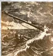
Garibaldi naufrago dopo l'incisimento del "Tamarindi" sul lago di "Tamarindi" [da "Illustrated London News", 1861]

Quando e come io imparassi a nuotare, non me ne sovvengo affatto, mi sembra di avere sempre conosciuto questo esercizio, come se io fossi nato anfibio. In tal modo e ad onta della poca smania che io abbia a lodarmi, come ben sanno tutti coloro che mi conoscono, dirò semplicemente e senza bisogno che sia questo un vantarsene, che sono uno dei più forti nuotatori che esistano. Non bisogna dunque farmi alcun merito, essendo conosciuta la fiducia che in me ritengo, di non aver mai esitato a gettarmi nell'acqua per salvare la vita di alcuno dei miei simili."