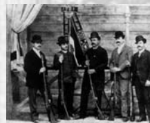
Memori della Società Mandamentale di Brescia alla gara nazionale di Tiro a segno svoltasi a Roma nel 1890

L'impegno del Generale si manifesta anche a livello parlamentare nella sua veste di senatore, allorché promuove la legge che istituisce il Tiro a segno Nazionale (legge n. 883 del 2.7.1882). Lo