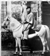
Il Generale sulla prediletta cavalla "Marsala"

Nelle pagine delle Memorie di Giuseppe Garibaldi scritte da Alessandro Dumas nel 1860, l'Eroe dei due Mondi sottolinea con qualche enfasi alcune sue abilità sportive: